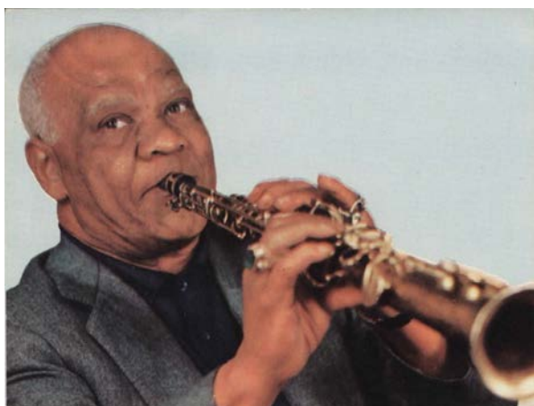
Sydney Bechet, au saxophone soprano