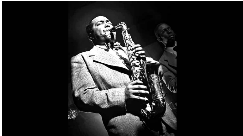
Charlie Parker au saxophone alto