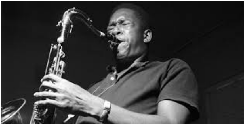
John Coltrane au saxophone ténor