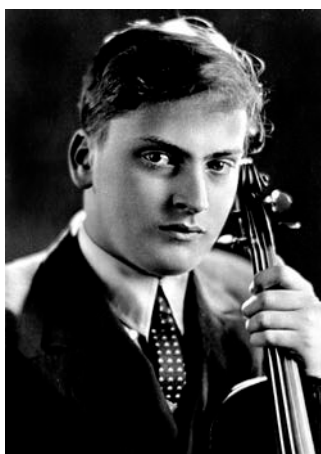
Yehudi Menuhin (1916-1999) Violoniste américain

Jouer du violon peut ainsi permettre d'accéder à des sensibilités artistiques correspondant à différentes civilisations, à d'autres mentalités culturelles, et même, d'en mesurer l'évolution à travers les époques. Le violon passe pour un instrument difficilement accessible, réservé à des enfants jeunes. S'il est admis qu'un apprentissage précoce de l'instrument entraînerait une sensible modification au niveau de la plasticité cérébrale (comme n'importe quel instrument...), on peut bien évidemment commencer le violon à tout âge !