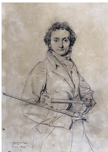
Niccolò Paganini(1782-1840), violoniste italien

Jouer du violon peut ainsi permettre d'accéder à des sensibilités artistiques correspondant à différentes civilisations, à d'autres mentalités culturelles, et même, d'en mesurer l'évolution à travers les époques. Le violon passe pour un instrument difficilement accessible, réservé à des enfants jeunes. S'il est admis qu'un apprentissage précoce de l'instrument entraînerait une sensible modification au niveau de la plasticité cérébrale (comme n'importe quel instrument...), on peut bien évidemment commencer le violon à tout âge !